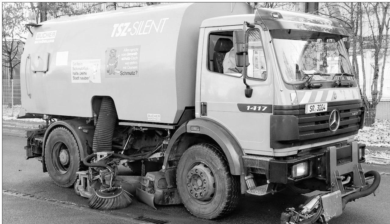
Am Freitagvormittag reinigten die Bauhofmitarbeiter noch die Straßen, ab Sonntag sind sie voraussichtlich wieder als Winterdienst unterwegs.